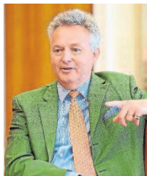
Frederich von Württemberg