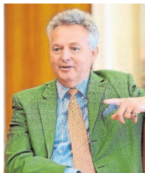
Frederich von Württemberg

Gebhard Fürst, acudieron alrededor de 2.000 personas, entre las que figuraron destacados miembros de la realeza europea, como los Reyes de los Belgas, el Duque de Braganza, el Príncipe de Piemonte, la Gran Duquesa de Luxemburgo, con su suegro, el Gran Duque Juan de Luxemburgo, el Margrave de Baden, el duque Franz de Baviera, el Príncipe Alexander zu Schaumburg-Lippe y representantes de las Casas de Orleans y Calabria, así la presidenta del Parlamento de Baden-Württemberg, Muhterem Aras, y el ministro de Interior de este land, Thomas Strobl.