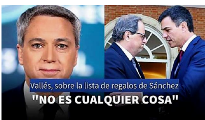
El recado de Vicente Vallés a